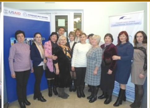
Тренінг «Робота PR-клубів бібліотек в умовах децентралізації» у рамках проекту «Розробка курсу на зміцнення місцевого самоврядування в Україні»

У середньому на 1 сільську бібліотеку-філію у 2017 р. було виділено 58,7 тис. грн.