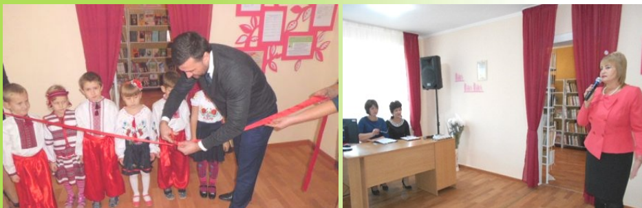
Новомиколаївська сільська бібліотека-філія Вітовської ЦБС