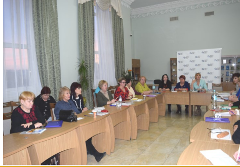
Рада директорів ЦБС та керівників бібліотек ОТГ «Актуалізація публічної бібліотеки у сучасній громаді»