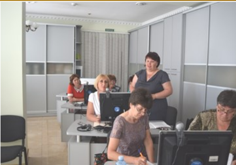
Семінар-тренінг «Адміністративні послуги для громади: доступ через бібліотеки»