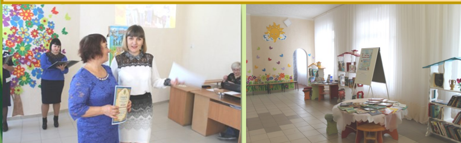
Врадіївська районна бібліотека для дітей

Управління культури, національностей та релігій Миколаївської обласної державної адміністрації