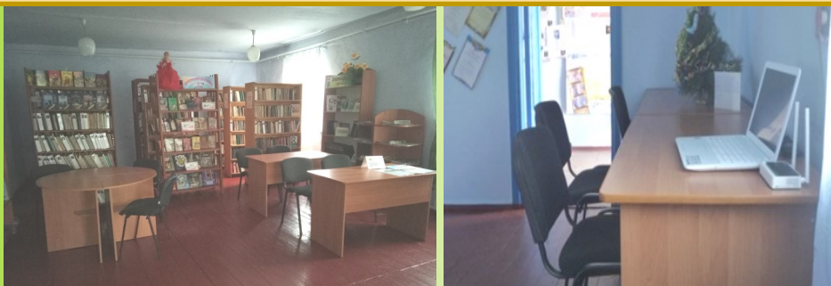
Трудолюбівська та Новотимофіївська сільські бібліотеки-філії Снігурівської ЦБС