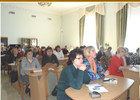
Тренінг «Публічна бібліотека: сучасні виклики та орієнтири розвитку» за участю головного бібліотекаря науково-методичного відділу Національної бібліотеки України імені Ярослава Мудрого