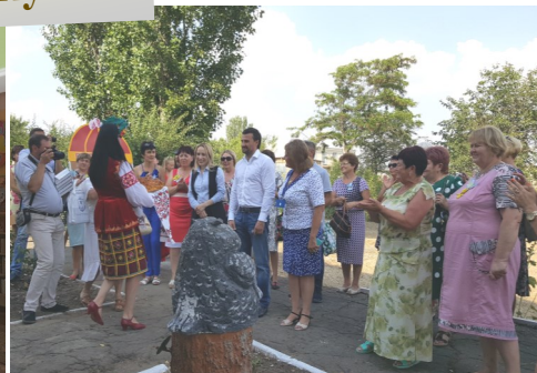
Регіональна Літня школа з адвокації «Бібліотечна адвокація: дієвість, втілена в результат»