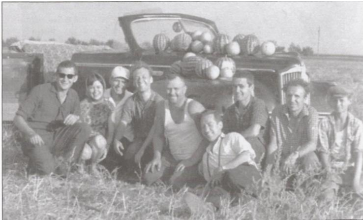
Знімальна група кіностудії ім. О. Довженка під час роботи над художнім фільмом за романом О. Сизоненка «Білі хмари»